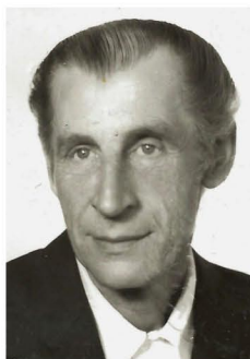
Henryk Durczok 86 lat