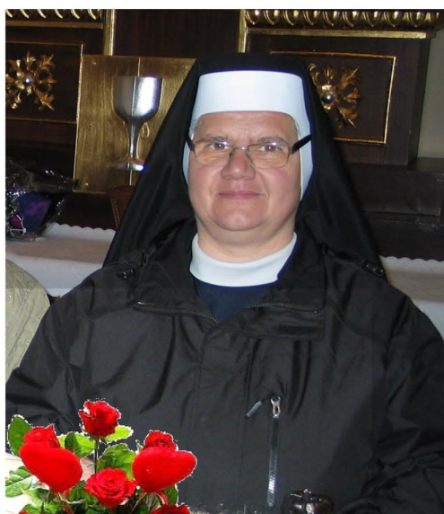
S. M. Agata — Imieniny